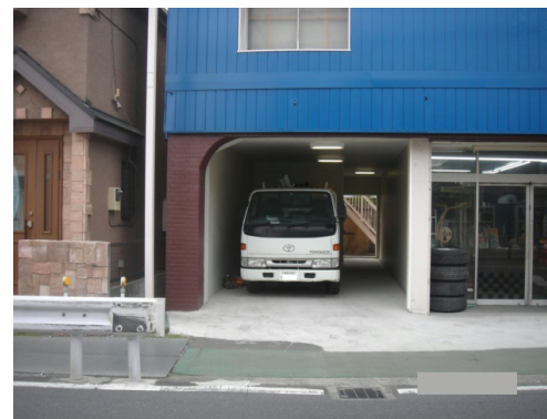
共通停車スペース