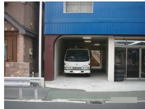
共通停車スペース